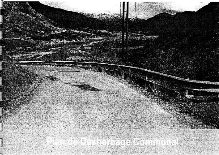
Plan de Désherbage Communal